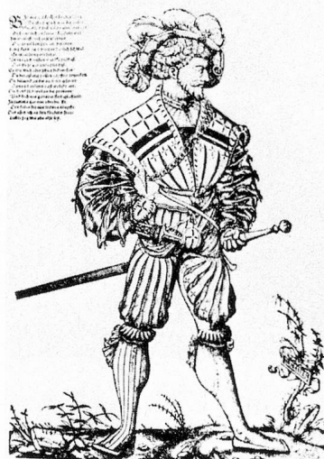
Capitaine suisse au service de France

Ouvrage traçant l'épopée du service étranger couvrant la période allant du Concile de Bâle