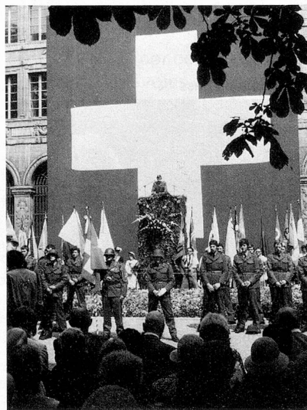
Fête nationale du 1 er août

Il ne faut cependant pas perdre de vue le fait que le Service des Suisses de l'étranger n'est pas un organe de défense des intérêts des Suisses émigrés, mais bien un service officiel qui s'efforce de tenir la balance équilibrée dans la