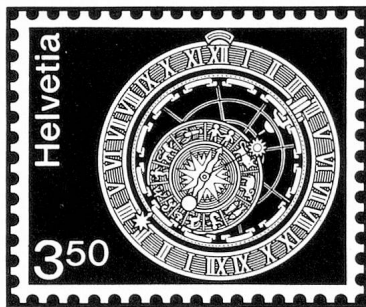
Cadran astronomique de la Tour de l'Horloge à Berne