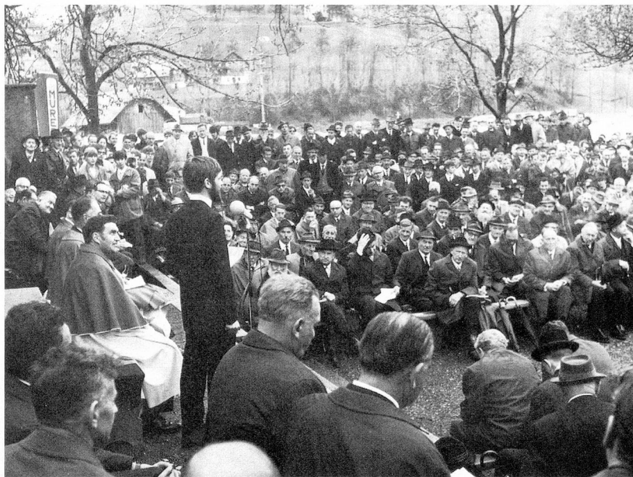
Landsgemeinde à Stans

du canton, ne reçoit pour ainsi dire pas de soleil durant les mois de décembre et de janvier.