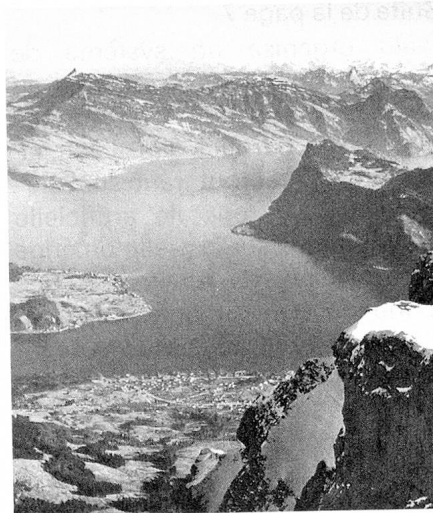
Vue sur le Bürgenstock et le lac des Quatre-Cantons

gemeinde». Chaque dernier dimanche d'avril elle est ouverte par les mots: «Getriiwi, liebi Landsliit» (chers et fidèles compatriotes). Cette réunion se tient à Wil an der Aa où l'on procède à l'examen et à la discussion des affaires canto-