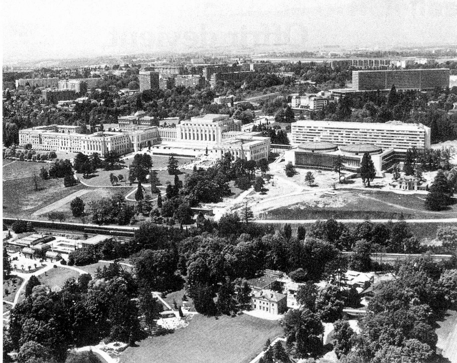
Les offices de l'ONU à Genève

long terme accomplir un travail efficace. Il est devenu nécessaire de prendre part de manière continue aux travaux des Nations Unies afin de pouvoir suivre les problèmes du début à la fin. Nous devons aussi être à même de réaffirmer nos vues et de faire progresser les conceptions auxquelles nous sommes attachés. C'est ainsi que notre absence volontaire de l'ONU nous fait courir le risque d'un isolement qui ne peut que desservir nos intérêts. La raison nous commande donc de prendre une part entière à la coopération politique, économique et sociale qui se déroule au sein de l'ONU. Nous pourrions ainsi mettre fin aux inconvénients qui résultent pour nous, aujourd'hui, du fait que notre participation y reste limitée dans divers domaines. Nous serons en mesure de mieux défendre nos intérêts et de présenter nous-mêmes directement notre politique à la communauté des Etats. Ceci est d'autant plus important que nous avons toujours considéré qu'une participation ac-