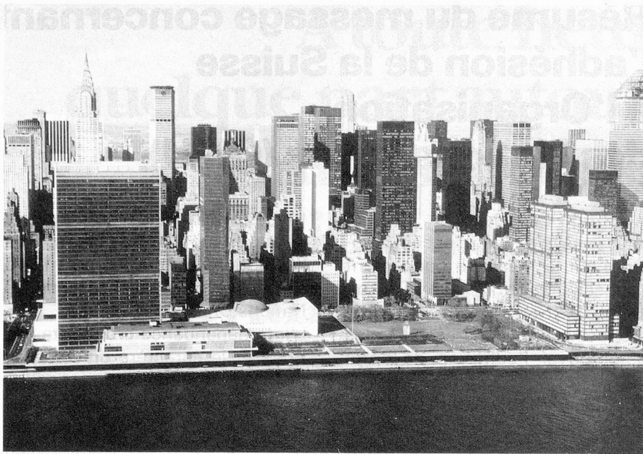
L'ONU à New York

transformé la nature des conflits et ceci a conduit l'ONU à concevoir de nouvelles méthodes de maintien de la paix , telles que l'envoi de missions de médiation ou d'observation et de contingents de Casques bleus. L'ONU a créé ainsi, sur une base volontaire, un instrument capable de créer les conditions préalables à un règlement pacifique ou de contribuer à la recherche d'un tel règlement.