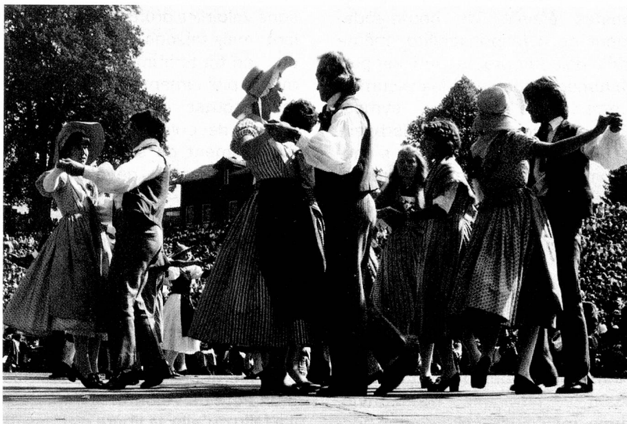
La danse populaire est encore très vivace en Suisse.