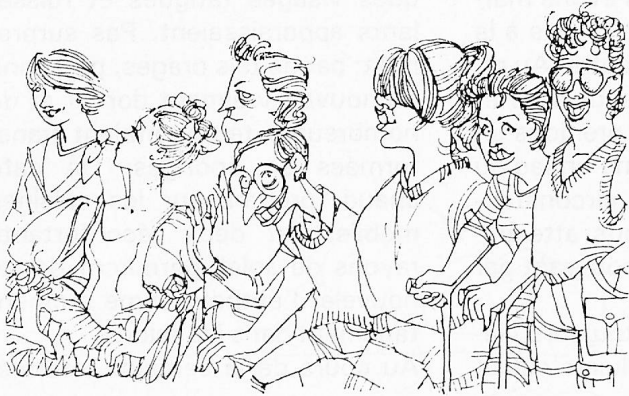
le groupe théâtre connaît un vif succès...