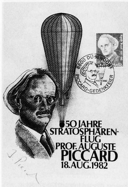
Un timbre commémoratif pour Auguste Piccard

temps perdu dans les hauteurs, l'équipage se trouva trop loin du point d'atterrissage prévu et dut se poser sur un glacier.