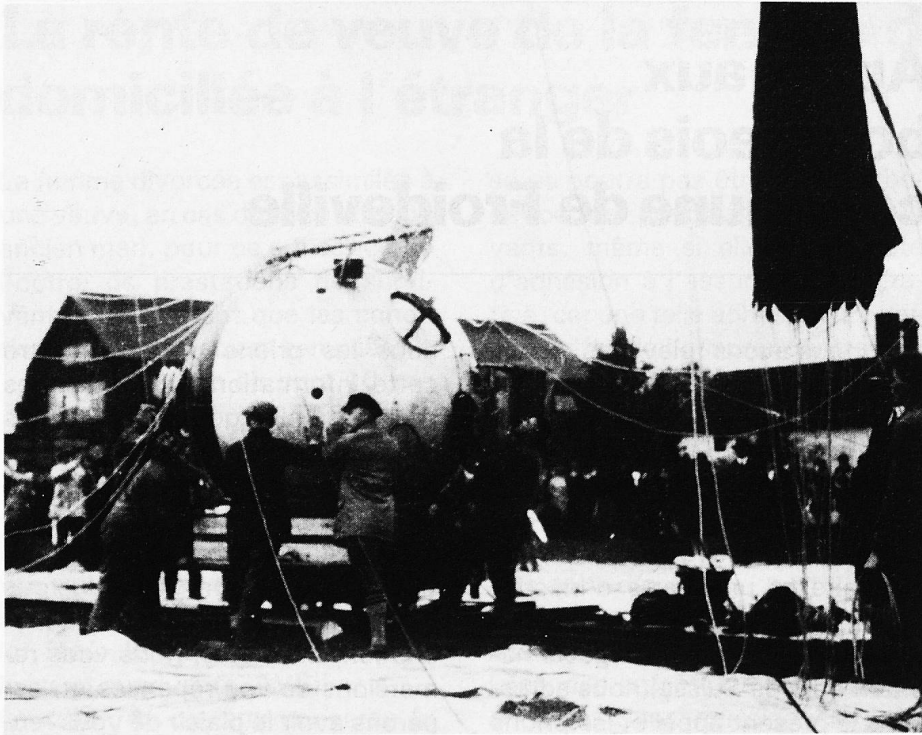
Le vol d'Auguste Piccard dans la stratosphère»

et dans un milieu extrêmement froid, n'a aucune chance de survivre. Faisant appel à un souvenir d'enfant, Auguste Piccard se mit à imaginer la construction d'une capsule hermétique et détachable comme solution à ces obstacles. La capsule en question était censée être catapultée dans la stratosphère depuis un ballon. Le 26 mai 1931, celle-ci fut parée pour un premier vol expérimental. Cet essai échoua en raison de vents très violents. Le lendemain, les préparations au départ furent à nouveau programmées mais le personnel au sol fit remorquer le ballon sans en avertir les deux pilotes, soit Auguste Piccard et Paul Kipfer. Ce départ «amateur» faillit engendrer une tragédie, la tempête de la veille ayant endommagé une pièce et provoqué une fuite importante. Les occupants parvinrent néanmoins mais non sans mal à éviter la catastrophe. Malgré tout, l'aventure ne faisait que commencer! En effet, une soupape mal fermée retarda la programmation du retour et il s'en fallut de