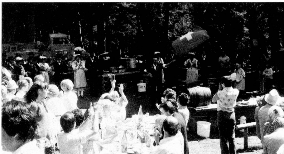
Un groupe folklorique agrémenté l'excursion du dimanche.

L'après-midi fut consacré à divers problèmes et avant tout au message du Conseiller fédéral Aubert qui rendit son auditoire attentif au travail de son Département, actuellement préoccupé par les relations de la Suisse avec l'ONU. Il défendit la thèse de l'interdépendance internationale toujours croissante, à laquelle la Suisse ne peut se soustraire, son adhésion à l'ONU s'avère nécessaire dans le cadre de la politique extérieure traditionnelle et pragmatique. Au début, les relations extérieures de