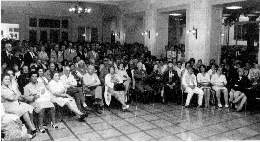
Pendant l'ouverture officielle.