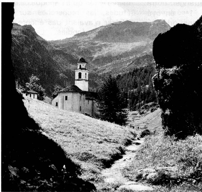
L'église de Bosco-Gurin