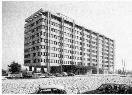
Caisse de compensation à Genève.

H. G. Le nouveau système est déjà appliqué dans près de 50% des cas. Nous admettons des exceptions là où les transferts de devises sont soumis à de fortes restrictions, s'il s'avère possible d'effectuer des compensations entre les cotisations et les rentes. Si nécessaire, nous nous efforçons aussi de trouver des solutions pragmatiques; c'est ainsi qu'en Italie tous les cotisants font leurs versements sur un seul