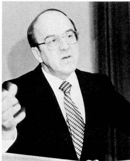
Notre hôte d'honneur, Monsieur Kurt Furgler

Le cadre aussi était original puisque c'est à la MUBA, foire fort connue de nos compatriotes de l'étranger, moins attrayante peut-être qu'un village typique suisse, mais tout aussi intéressante par les possibilités offertes de découvrir notre pays sous un autre as-