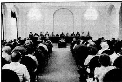
L'heure des questions dans la salle Guisan