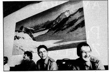
Arrivée à la gare