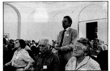
Une question intéressante