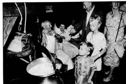
Rencontre dans une fromagerie