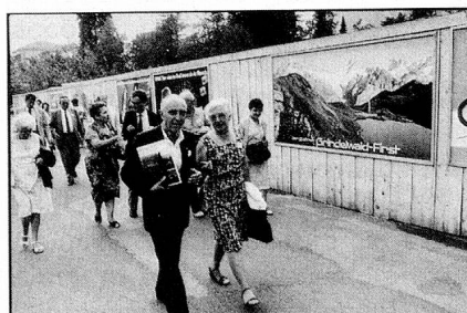
Promenade dans le village