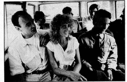
Le sourire de la jeunesse