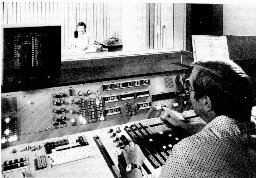
Régie d'émission en 1985

L'une des principales réalisations a été la mise sur pied, en 1962, de la première rédaction d'informa-