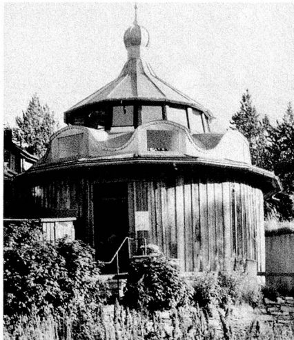
L'atelier Segantini

L'une des œuvres les plus importantes de Giovanni Segantini (1858 à 1899) est le triptyque «La Vie, la Nature et la Mort». Acquis par la Fondation Gottfried Keller, à Zurich, il se trouve au Musée Segantini à Saint-Moritz, depuis 1908. Ce triptyque était une commande faite à Segantini pour l'Exposition universelle de 1900 à Paris. Avec cette «symphonie alpine, reproduction fidèle de la nature», placée dans le Pavillon suisse, on espérait promouvoir le tourisme naissant en Haute-Engadine. Mais des raisons financières ont empêché cet ambitieux projet de se réaliser.