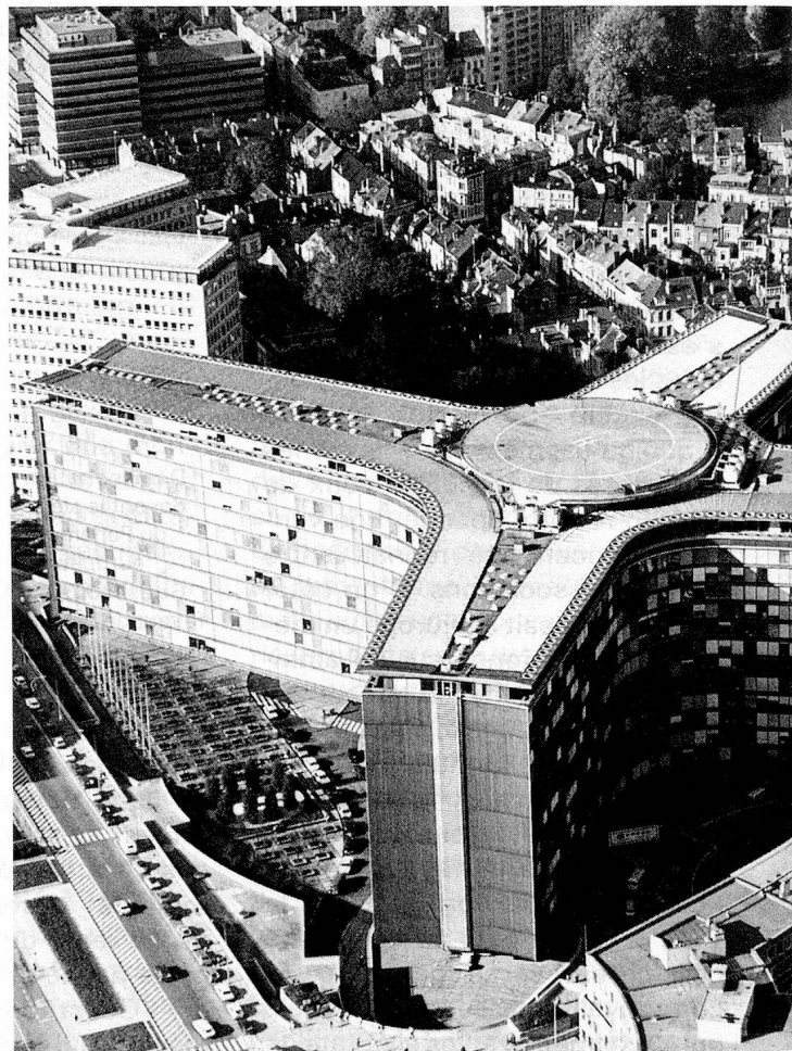
Siège de la Commission de la Communauté européenne: le Palais Berlaymont à Bruxelles.

Grand-Rue 52 1820 Montreux (Suisse) Tél. 021 63 73 73