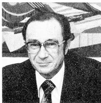
Président de la Confédération: Pierre Aubert

Né le 3 mars 1927 à La Chaux-de-Fonds. Originaire de Sava-gnier/NE. Marié et père de deux enfants. Avocat. Conseiller fédéral depuis le 7 décembre 1977.