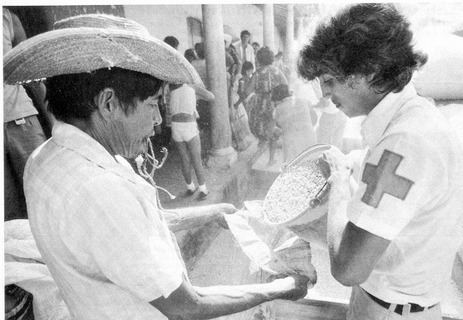
Distribution par le CICR de «frijoles», aliment de base de la population salvadorienne.

Il est vrai qu'il y a des raisons d'espérer que l'exclusion de la délégation gouvernementale sud-africaine (la Société de la Croix-Rou-