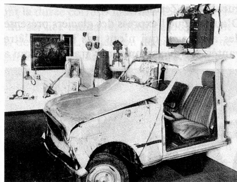
L'exposition «Le mal et la douleur» au musée d'ethnographie de Neuchâtel.

Les visiteurs qui se passionnent pour les animaux trouvent leur bonheur à Estavayer-le-Lac où un ancien capitaine de la Garde suisse du Vatican, François Perrier, a consacré