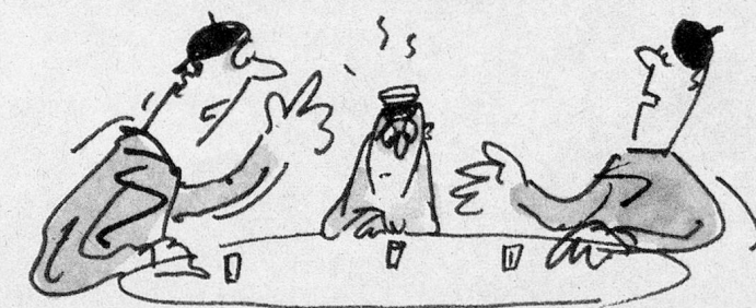
Le cauchemar: Se retrouver isolé sans pouvoir communiquer. Les étudiants bien préparés n'ont pas de soucis à se faire.

mand ou le français: il n'y a pas d'université en Suisse italienne). Les candidats de langue maternelle étrangère sont en général contraints de se plier à un examen de langue;