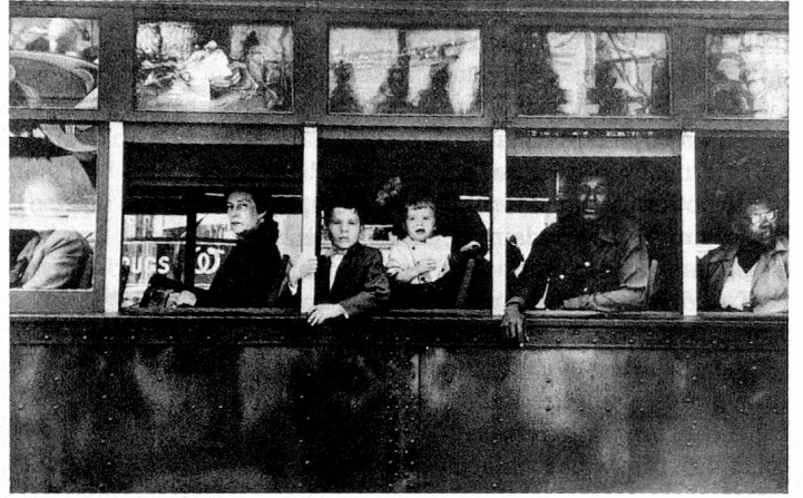
Robert Frank, La Nouvelle-Orléans, 1955-1956