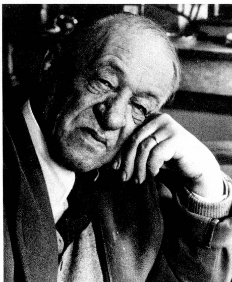
Blaise Cendrars dans les années cinquante à Paris.