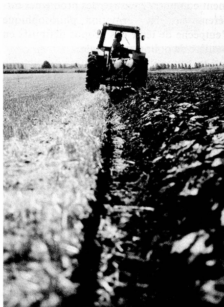
Paysan du plateau aux labours.

Or, c'est exactement cela que l'on reproche aujourd'hui aux paysans et à la politique agricole qui est à l'origine de ce cercle vicieux. L'agriculture intensive des temps modernes a conduit à des excès dans l'élevage du bétail, notamment dans celui des porcs et des poules. Il y a aujourd'hui des paysans