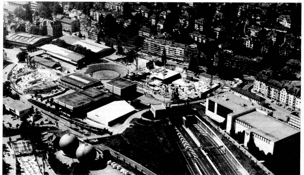
En raison d'importants travaux de construction, les organisateurs de l'OLMA, la grande foire suisse de l'agriculture qui se tient à Saint-Gall, ont dû trouver cette année, du 8 au 18 octobre, des solutions provisoires.