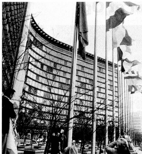
... mais n'entrera sans doute jamais dans le bâtiment de la CE à Bruxelles.

«politique active d'intégration», qui éviterait par la suite des discriminations.