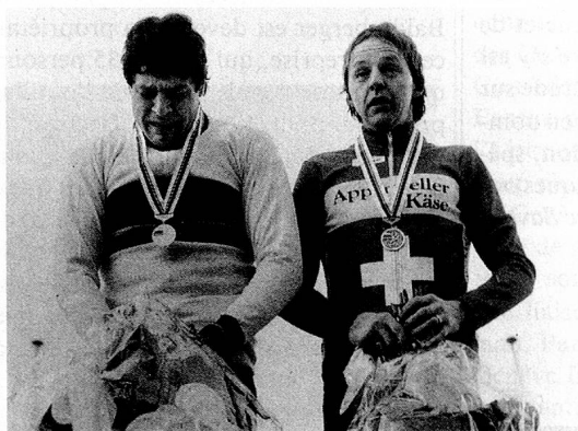
Pascal Richard, le roi suisse de la piste boueuse.