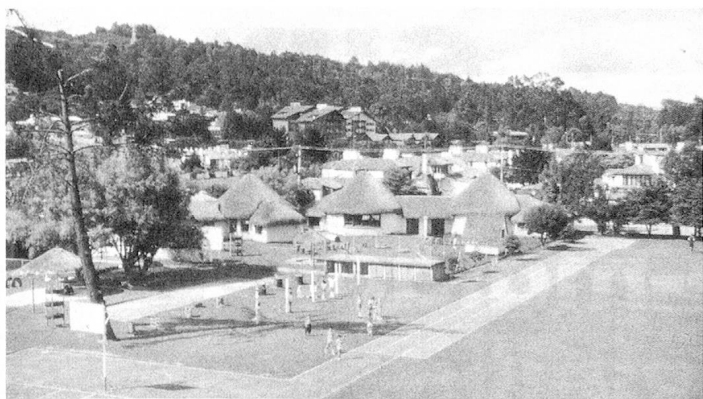
Ecole suisse à Bogotà, Colombie, au premier plan les édifices aux toits de paille du jardin d'enfants, à l'arrière-plan l'édifice de l'école.

établir ainsi leurs prestations, en fonction du modèle donné par le plus généreux d'entre eux. A part les contributions volontaires pour des projets d'investissements extraordinaires, avant tout des constructions, cela touche tout particulièrement la mise en congé des enseignants de leur activité pour enseigner dans une école suisse, ainsi que la possibilité pour eux d'être maintenus dans la caisse de pension de leur canton.