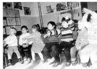
Le jardin d'enfants de l'école suisse à Catane, Italie.

FC: En ce qui concerne les formes d'encouragement, on ne trouve guère de limitations pour autant que l'élément suisse y tienne le rôle prépondérant. Il va de soi que cet enseignement doit être assuré sur une base politique et confessionnelle neutre et dans un but non lucratif. Il ressort toutefois que l'on n'a