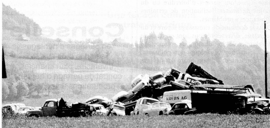
Loin des yeux, loin du cœur? L'assainissement des décharges inappropriées dure des années et provoque des frais énormes.

Outre ces usines d'incinération, où l'on brûle environ 80 pour cent des déchets urbains, nous ne disposons en Suisse que d'un petit nombre d'installations équipées pour la mise en valeur ou la transformation de cer-