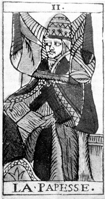
Carte d'un jeu de tarots datant de 1760 environ, représentant la papesse.

Les jeux de cartes du moyen âge ont un point commun avec ceux qui les ont remplacés aujourd'hui: ils sont divisés en quatre couleurs. Comme on le sait, nos jeux de yass ont conservé jusqu'à ce jour cette répartition. Les cartes allemandes ont leurs propres noms («Schilten, Schellen, Rosen, Eicheln»). Pour les cartes françaises, on parle de pique, carreau, cœur et trèfle. Ces quatre couleurs sont peut-être une survivance de la prédilection qu'avaient les anciens pour une