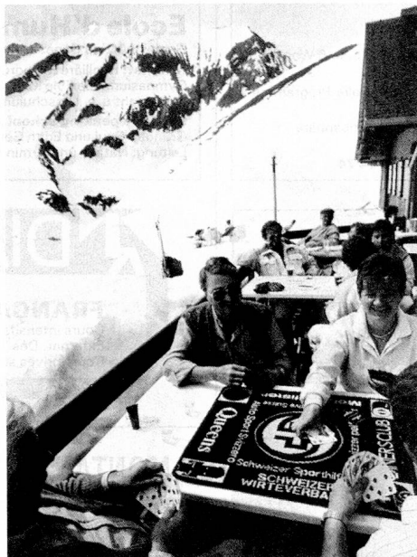
Yass de plein air à l'Engstligenalp dans l'Oberland bernois.

tions et concluaient des alliances «tous azimuts»; elles subirent par conséquent, dans le domaine des règles des jeux de cartes, des influences très variées. Ce n'est qu'au 19 e siècle qu'est né un Etat qui se fondait sur une économie en plein développement. Désormais, on avait besoin de ces jeunes gens dans les administrations et les usines. Très logiquement, on a donc édicté des règles de plus en plus sévères interdisant le service mi-