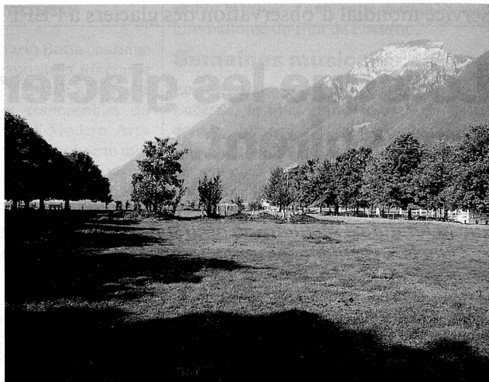
Place des Suisses de l'étranger à Brunnen: lieu de rencontres et de méditation

son de plus pour attaquer la dernière étape avec élan et détermination.