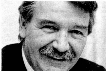
René Felber, conseiller fédéral: La Place des Suisses de l'étranger est un symbole pour la politique extérieure suisse.

(Fondation Place des Suisses de l'étranger à Brunnen), Banque Cantonale de Schwyz, CH-6430 Schwyz.