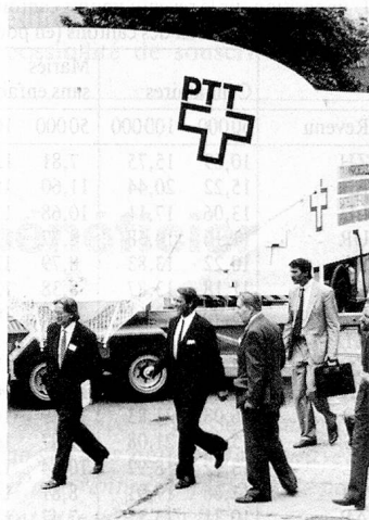
«L'oreille» du monde: le conseiller fédéral Ogi (au milieu) devant la station mobile de réception de satellites à Naefels.