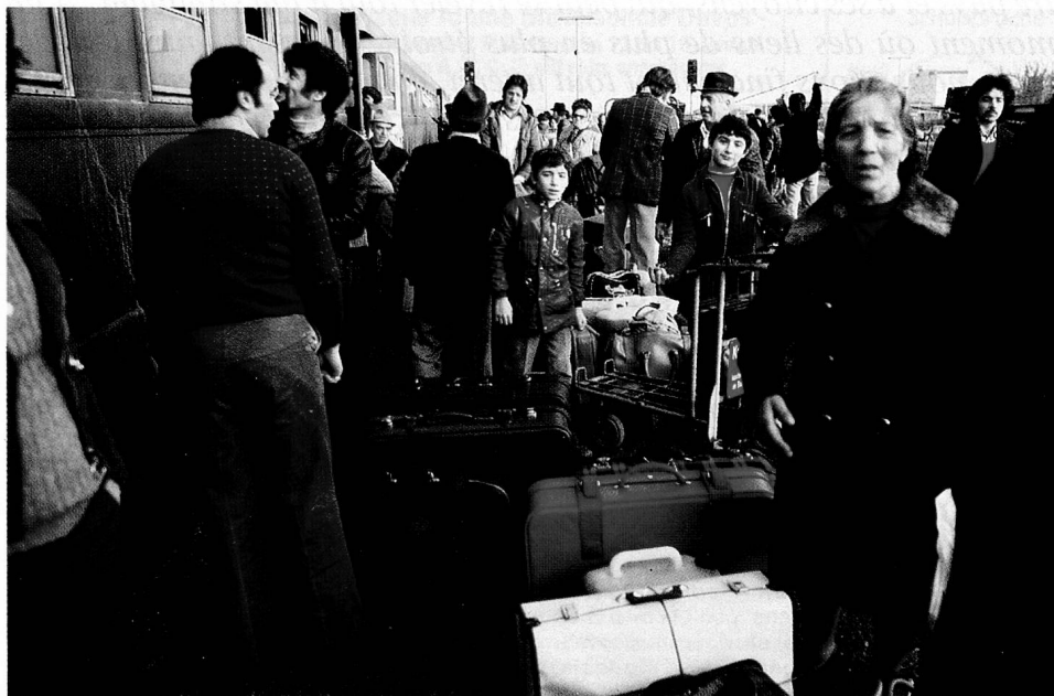
La politique d'immigration de la Suisse est en contradiction flagrante avec la libre circulation de la main-d'œuvre dans les pays de la CE.

Cela dit, il ne faut pas prendre le marché intérieur pour davantage qu'il n'est, ni mésestimer les obstacles considérables qu'il s'agira de surmonter avant qu'il ne devienne réalité. Le marché intérieur n'est fondamentalement rien d'autre qu'un espace dépourvu de barrières douanières (il l'est déjà), fiscales, administratives, techniques, et enfin physiques (plus de «douanes» aux frontières). C'est aussi, on l'oublie souvent, un