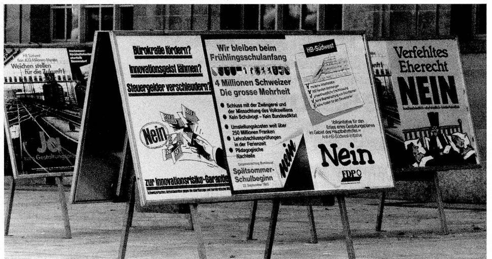
L'initiative et le référendum, droits populaires: la question de la compatibilité de nouvelles lois suisses avec celles de la CE est posée, que la Suisse adhère ou non à la CE.

Selon le Conseil fédéral, la principale question qui se pose aujourd'hui est de savoir comment la Suisse peut faire partie de cette