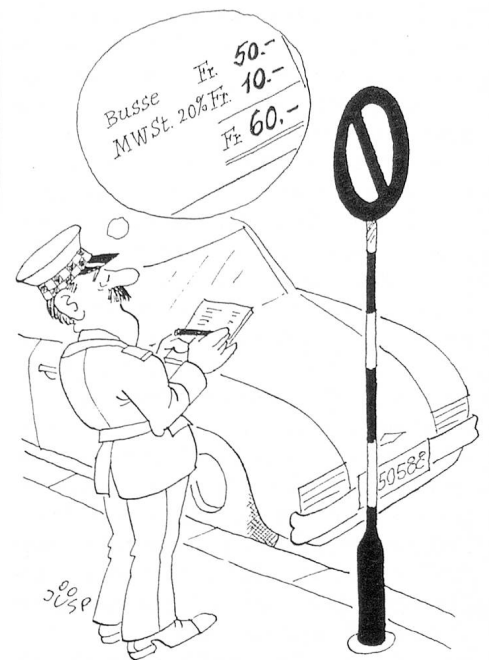
Bientôt la TVA en Suisse?

Aujourd'hui déjà, les rédacteurs législatifs s'efforcent dans toute la mesure du possible d'élaborer des textes qui soient conformes