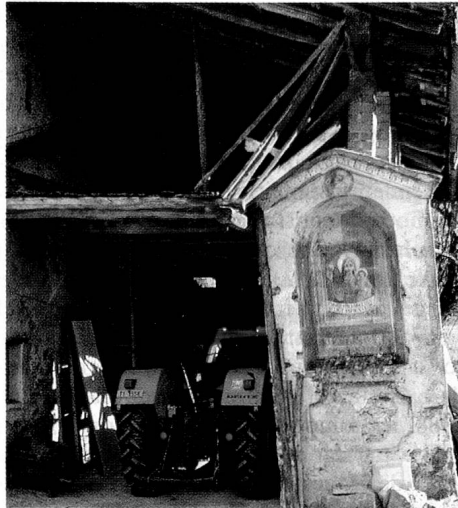
L'agriculture tessinoise est aujourd'hui devenue marginale.

Pour ce qui est des idées et des bonnes intentions, le canton du Tessin est un élève modèle en matière d'aménagement du territoire. Le Conseil d'Etat du Tessin ne s'est pas contenté d'élaborer lui-même le plan directeur cantonal prescrit par la Confédération, comme l'ont fait plusieurs cantons. Au Tessin, le plan directeur – qui précise où l'on a le droit de construire et où l'agriculture doit