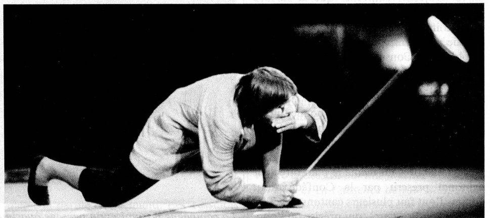
Sur scène, le clown Dimitri, célèbre dans le monde entier.

En revanche, les «boccalini» ont un peu passé de mode. Jusqu'à une époque récente, ils étaient un des symboles du tourisme, auquel on essaie aujourd'hui de donner un nouveau