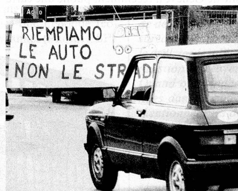
Protestation contre les pendulaires venant en voiture, dans le Malcantone: «Remplissons les voitures et non les routes.»

Ces chiffres montrent la profonde évolution de l'organisation territoriale cantonale. Le Tessin, une des régions les plus montagneuses de Suisse, est aujourd'hui parmi les plus urbanisées – le 76% de la population réside dans les quatre agglomérations de Lugano,