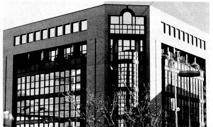
Lugano, ville de banques.