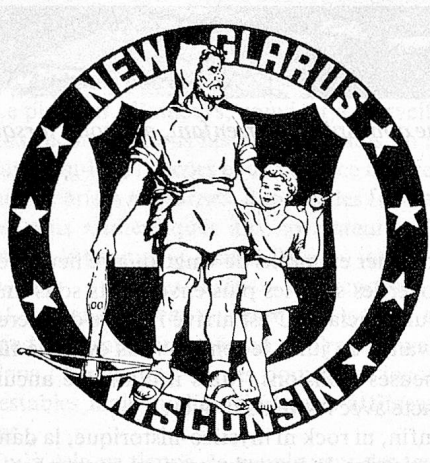
...faisant le tour du monde (colonie suisse de New Glarus aux Etats-Unis)...