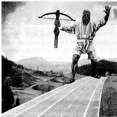
Guillaume Tell menant un combat politique («Halte au béton»)...