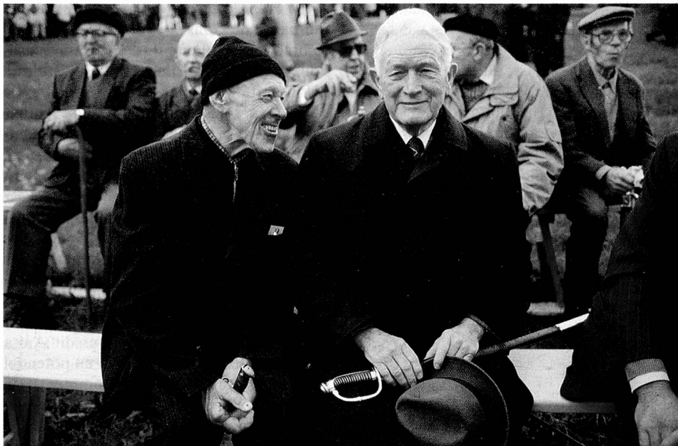
Pour la dernière fois entre eux: les hommes des Rhodes-Extérieures à la landsgemeinde (avec l'épée servant de carte d'électeur).

La question du droit de vote des femmes dans le canton d'Appenzell n'est pas l'un des chapitres les plus glorieux de notre démocratie. Le demi-canton d'Appenzell Rhodes-Extérieures vient de décider d'accorder le droit de vote aux femmes. Il est l'avant-dernier (demi-)canton et, à notre connaissance, l'avant-dernier Etat du monde à le faire. Après quatre votes négatifs, la landsgemeinde (composée d'hommes) du 30 avril 1989 à Hundwil s'est enfin prononcée en fa-