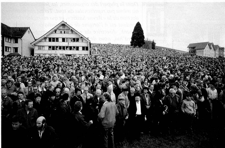
La landsgemeinde historique du 30 avril 1989 à Hundwil (Appenzell Rhodes-Extérieures): les femmes obtiennent enfin l'égalité des droits.