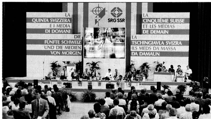
Un congrès consacré aux médias, dans un décor de studio de télévision.

tenir spécialement compte des besoins des Suisses de l'étranger. Cependant, ces bonnes intentions se heurtent actuellement à certaines limites d'ordre technique; beaucoup de Suisses de l'étranger ne le savent que trop bien. Le spécialiste des PTT