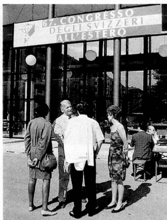
Lieu de rencontre: le Congrès des Suisses de l'étranger.

lites» de la SSR, qui a opté pour la participation à la diffusion de différents programmes internationaux par satellites. Une table ronde entre spécialistes de l'information et spécialistes des médias, la projection de cassettes vidéo enregistrées par des Suisses de l'étranger ainsi que des suggestions faites par des participants ont débouché sur de nombreuses constatactions et propositions. Il est clair-