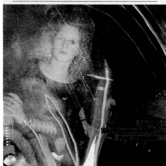
La disco, souvent décriée mais largement fréquentée: la distraction par excellence des jeunes de 14 à 20 ans