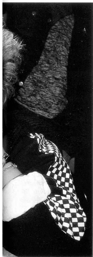
La difficulté de se trouver: la consommation dans l'ennui.

accepté que je fasse de la moto et me montrait les statistiques des accidents. D'une façon générale, il me semble que les personnes âgées ont une vue figée des choses et ne regardent plus que droit devant elles. Bien des choses seraient différentes si elles étaient