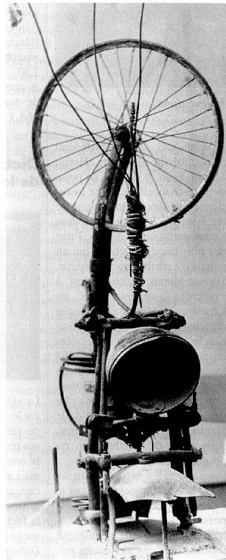
Jean Tinguely. «Hommage à Duchamp», 1965.

Le 29 août s'est éteint à Berne des suites d'une attaque l'artiste fribourgeois mondialement connu, Jean Tinguely, qui était âgé de 66 ans.