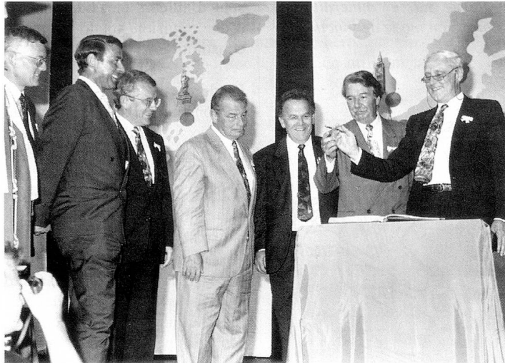
Tous les conseillers fédéraux inscrivent leur nom dans le livre des visiteurs.

«...En ce jour très spécial, j'adresse toutes mes félicitations à la Suisse. Qu'elle demeure toujours prospère, que ses montagnes ne s'écroulent jamais et qu'elle continue à produire du chocolat ...» (Indira Varma) SM