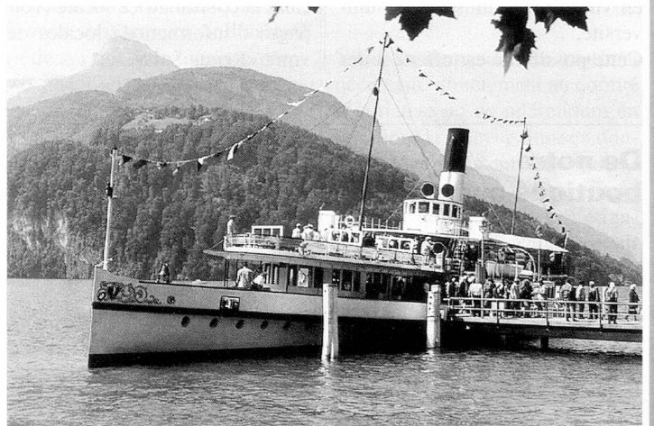
Lors de la traditionnelle excursion du dimanche, les congressistes se sont rendus à Brunnen en bateau.

Il ne saurait être question, pour A. Koller, de nous enfermer dans le cas spécial que constitue la Suisse. Il convient de ne pas laisser le réseau dense de nos méca-