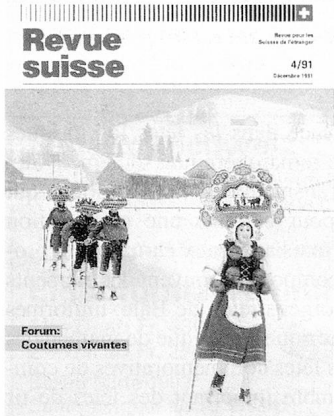
Les «Kläuse» mendiants d'antan sont devenus les beaux «Kläuse» de la plus célèbre de toutes les coutumes suisses de la Saint-Sylvestre.