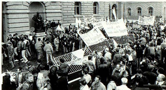
Les agriculteurs suisses protestent contre la réduction prévue des subventions.

donnés par les représentants des paysans ne peuvent cependant pas occulter le fait qu'une restructuration de l'agriculture est devenue inévitable, en Suisse également, en particulier dans la perspective de l'ouverture prochaine de notre pays sur l'EEE.