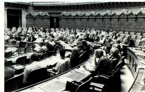
La séance bien fréquentée du Conseil des Suisses de l'étranger dans la salle du Conseil national.

présentations diplomatiques et consulaires, élaboration d'un système d'AVS/AI qui soit durable. Dans l'ensemble, cependant, M. Cevey s'est montré satisfait des résultats obtenus.