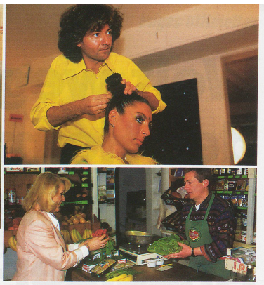
Que ce soit dans le secteur des services ou dans l'industrie, les petites et moyennes entreprises constituent le principal soutien de l'économie suisse.