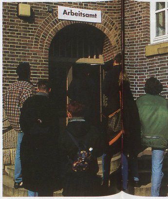
Des jeunes devant l'Office du travail. Le chômage et la pénurie de places d'apprentissage leur donnent du fil à retordre.

De son côté, la politique monétaire est dans une situation embarrassante. Malgré l'action de la Banque nationale, qui injecte – trop tard selon certains – davantage d'argent à des taux plus avantageux dans l'économie du pays, l'effet d'expansion n'atteint pas l'ampleur souhaitée, car les collectivités publiques doivent dans le même temps imposer de sévères mesures d'économie. La politique monétaire et la politique fiscale s'annulent donc mutuellement en quelque sorte; l'une favorise le pouvoir d'achat, l'autre le réduit. Cela va continuer ainsi pendant de nombreuses années encore, car si les communes ont commencé à équilibrer leurs budgets, les cantons et la Confédération doivent encore faire d'importants efforts d'éco-