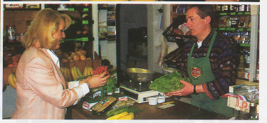
Que ce soit dans le secteur des services ou dans l'industrie, les petites et moyennes entreprises constituent le principal soutien de l'économie suisse.