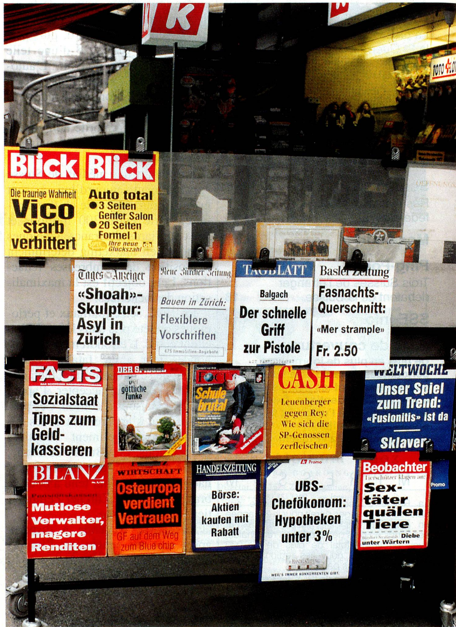
Chasse aux lecteurs: affiches de journaux en Suisse alémanique.