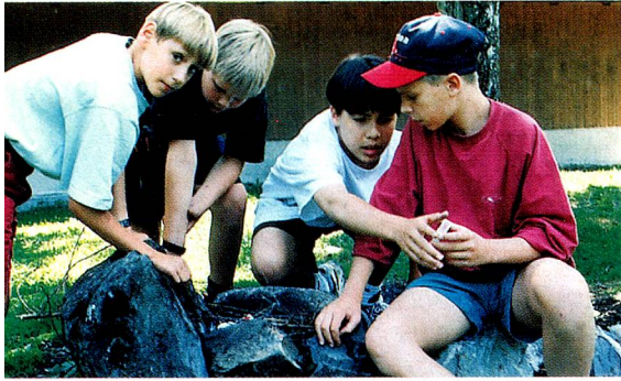
Du sport, des jeux et du plaisir aux camps d'été pour enfants et jeunes suisses de l'étranger.

La Fondation pour les enfants suisses à l'étranger organise une fois de plus, en 1999, des camps d'été pour les enfants suisses de l'étranger de 7 à 14 ans. Sur demande, elle peut accorder des réductions de prix (de